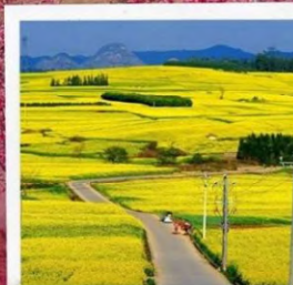
ทุ่งดอกมัสตาร์ด