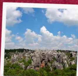
อุทยานป่าหิน