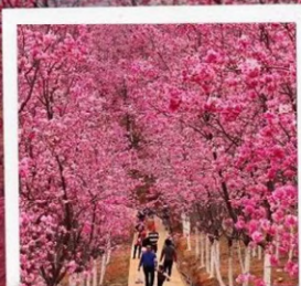
หุบเขาซากุระหมื่นลี